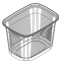
108 R Behälter